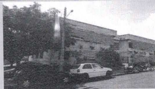
Registro de Localização.